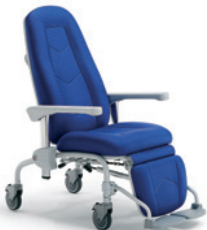
MR5068 Free Plus

Poltrona su ruote, movimenti indipendenti con pedana