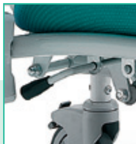
Leva laterale per il comando sincronizzato dello schienale e poggiatesta

Detail of the push handle and backrest made of thermoformed ABS