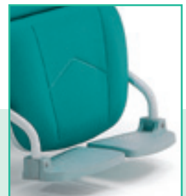
Pedana estraibile in ABS Extractable footrest