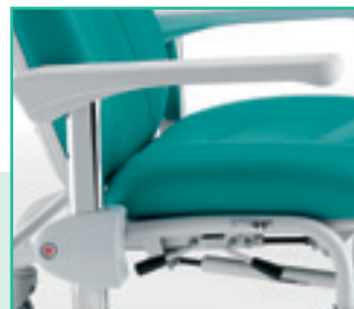
Bracciolo regolabile in 6 posizioni Armrest adjustable to 6 positions.

Releasing button for the armrest adjustment.