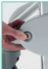
Pulsante di sblocco per la regolazione verticale del bracciolo

Lateral lever for the synchronized movement of the backrest and legrest.