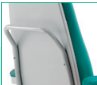
Particolare del maniglione di spinta e scocca in ABS termoformato dello schienale

Detail of the push handle and backrest made of thermoformed ABS