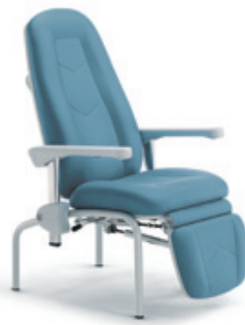
MR5062 Sincro Basic

Relax armchair on wheels, synchronized movements without footrest