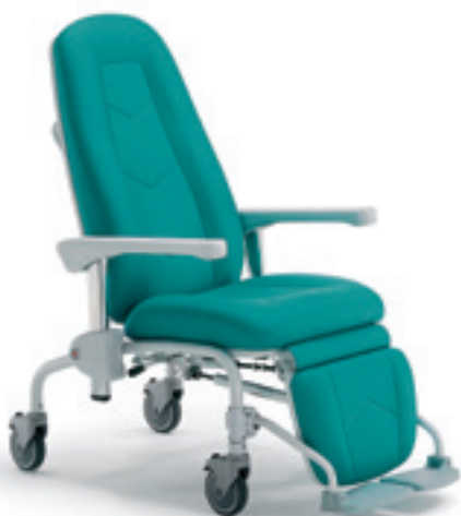
MR5066 Sincro Plus

Poltrona su ruote, movimenti sincronizzati con pedana