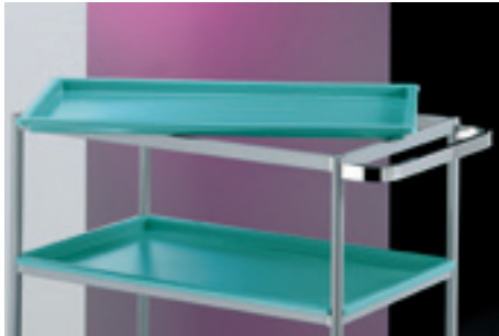
Particolare vassoio asportabile. Removable tray.

These models are all arranged to the application of a wide range of accessories.