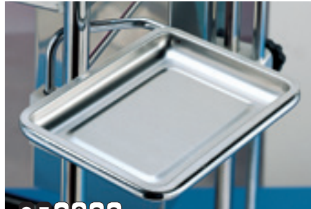
CZ9088 Vassoio girevole asportabile in acciaio inox. Revolving and removable stainless steel tray.