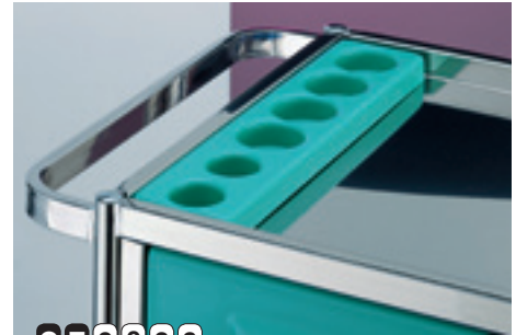
CZ9086 Porta boccette asportabile in ABS. Removable ABS bottles rack.